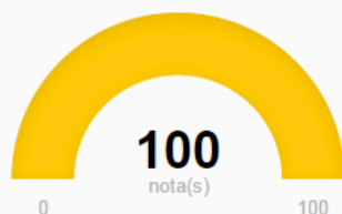
Tabela conversão N° de Notas

Você atingiu o número mínimo de notas e obteve mais esse benefício do Programa NFG!