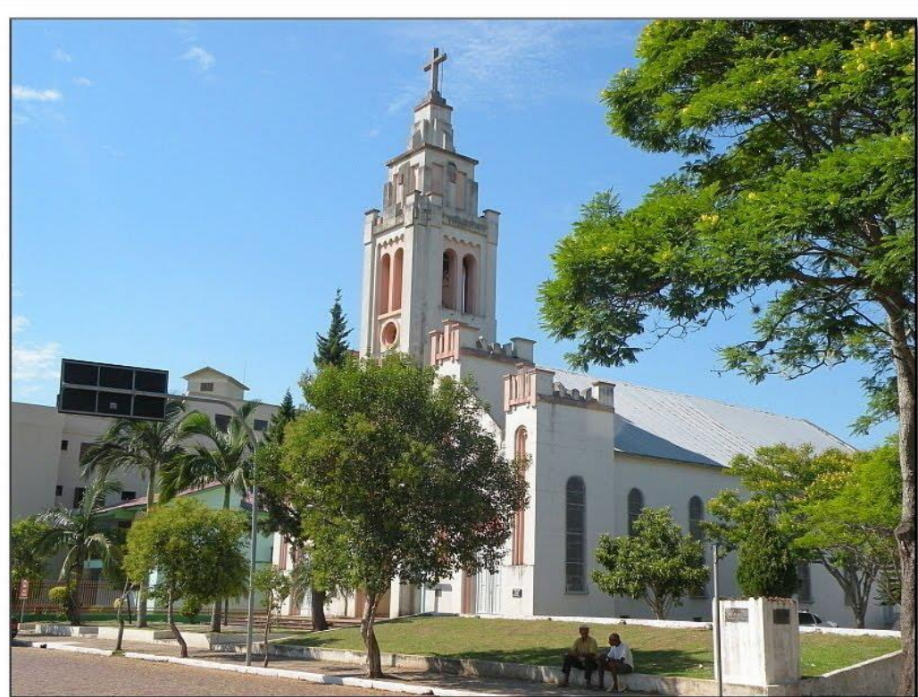
RESTINGA SECA, RS / IGREJA DO SAGRADO CORAÇÃO DE JESUS - I